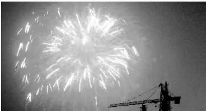
每年的焰火晚会都是市民的一道视觉盛宴。

由于今年是烟花爆竹“禁改限”头一年,市民除了可以自行燃放烟花闹元宵外,郑州市2007年元宵节焰火晚会,也将于正月十五(3月4日)20时至20时30分在郑东新区、市体育场和五一公园3个燃放点同时举行。据了解,这将是本市连续第七次举办元宵节焰火晚会。昨日下午,市政府召开元宵节焰火晚会筹备会,对今年的焰火晚会作出具体安排部署。与往年不同的是,今年的元宵节焰火晚会规模空前,3个燃放点各具特色,8500枚礼花将喜闹元宵。借鉴去年的经验,市政府特别指出,如遇天气等原因不适合燃放,燃放时间将另行决定。