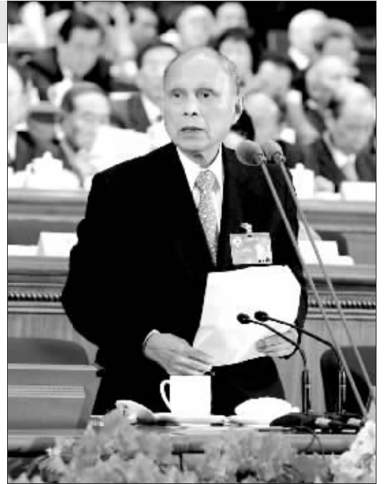
霍英东先生生于忧患,以自强不息成就人生传奇。逝于安乐,用赤诚赢得生前身后名。

霍英东,将毕生精力献给了祖国,一生“为善莫问回报”。他生前热爱运动,热心公益,香港和内地无数的教育机构、运输基建、地方团体都受过他的财政资助,行善多年至今捐献逾百亿元,“大慈善家”善心尽显,