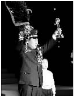
王百姓时时命悬一线,老百姓才能天天平安。

排爆专家王百姓,现任河南省公安厅治安管理处调研员,三级警监,高级工程师。从事排爆工作35年来,先后“摆平”各类炸弹1.5万多枚,排除爆破装置和哑炮1100多个,处置大小爆炸现场无数,是公安系统唯一没有伤残、排爆没出过一次差错的全国劳模。他创立的有关爆破理论和爆破方法填补了国内空白,为侦破案件及处理事故提供了重要的决策依据;他参与的“爆破治黄”等重点工程业务指导工作,有力地服务了社会经济的发展。