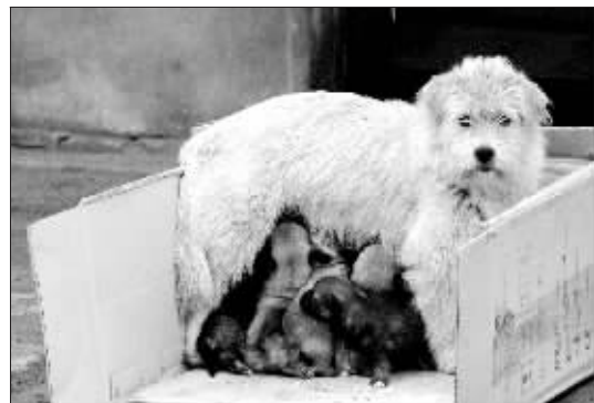
小狗们争相吃奶。晚报记者 张翼飞 实习生 黄余洋 图

公司的李师傅说:“这只流浪狗是杂交的‘西施’狗。狗妈妈的食物来源主要靠公司员工来上班时带点面条、馒头等食物喂它,别看它个子小,一天得4个馒头。”当问到狗宝宝被抛弃