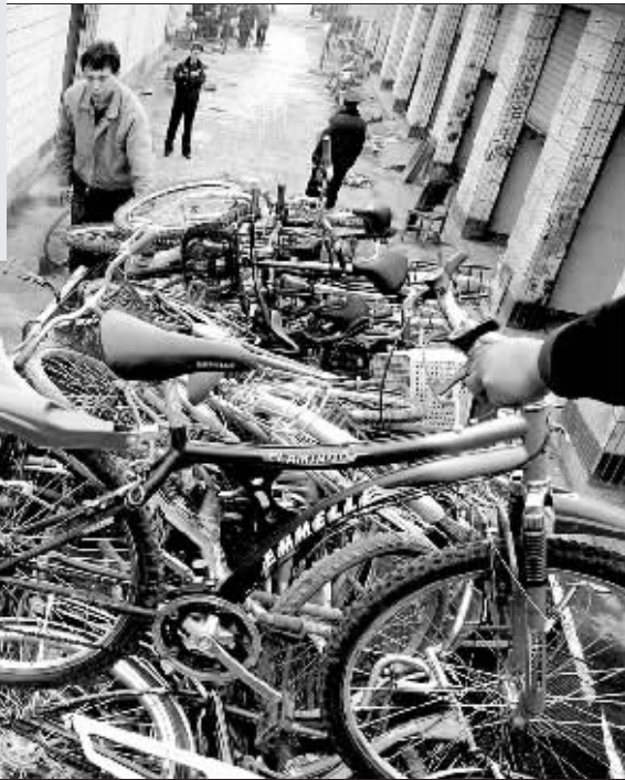
大卡车上装满了被警方查获的自行车