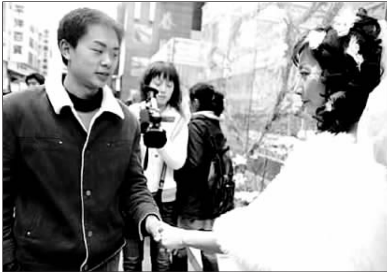
帅小伙儿主动要求与她交朋友

候与一位男生长达6年的青涩爱情,因她一直对自己的身体感到自卑,最后不得不以分手告终。