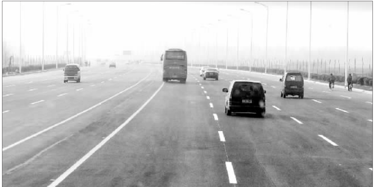
一条郑开大道,拉近两座城市。 晚报记者 周甬 图

随着郑开大道的开通,郑州和开封两座城市的距离无形中大大缩短,两地市民初步感受到了一体化给他们带来的好处。新的一年,两市将有哪些新的举措来推进郑汴一体化的进程?昨日,本报记者采访了在京参加全国“两会”的部分代表。