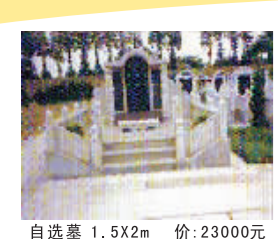
自选墓 1.5X2m 价:23000元