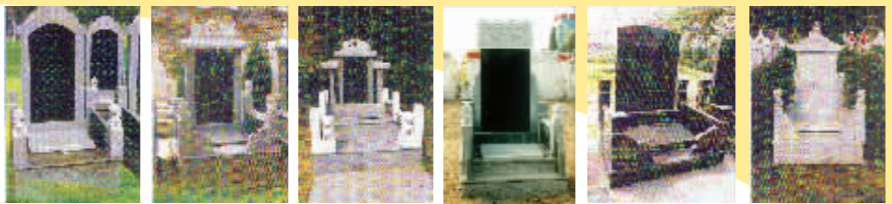
天皇园花岗岩 1.9X1.3m 价:8980元 2.1X1.32m 价12800元 1.5X2m 价26000元 自选墓 乾坤园 价:10800元 太极园 1.9X1.26m 价12800元 2X1.37m 价8800元 天皇园规划墓

金像陵园不仅仅是公墓，也是文化休闲场所，墓区按照园林化的要求，精心设计和建造了飞龙瀑、玉带桥、太极亭、步步高十多处自然景观和人文景观，还计划建造历代名人论述死亡的文化碑廊，这必然是陶冶情操的大好去处。人的一辈子，纵横几十年，为社会留下不少物质财富和精神财富，颇值得人们纪念。为此，公墓还特开辟了“英雄园”“留芳园”，这里也将成为人们瞻仰英雄模范人物，宣传精神文明的好地方。人都有一死，死后也并非是一葬了之。在金像陵园选个安葬之所，不仅在清明、阴历十月一传统节气来此扫墓便利；而且每封故人诞辰、祭日去寄托哀思，平日有什么心思需要向亡灵诉说告慰时，来这里实在是太理想了。英雄在此安息，犹如魂归故里，来此为亡人选个墓地倾尽一片小心，是我们对您的期待，也是您的造化。如有远见卓识，先来为老人预选和订购一块风水宝地，这的确是较明智的做法。