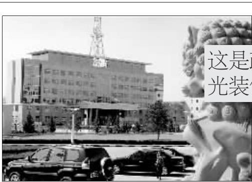
这是政府的楼 光装修就花了数百万

国家防总办公室统计显示,截至3月21日,湘、桂、琼、川、渝、云、贵7省份耕地受旱面积3878万亩,比3月上旬增加了750万亩,其中作物受旱2422万亩,重旱571万亩,干枯65万亩,缺水缺墒面积1456万亩,有981万人、919万头大牲畜饮水困难,比上月增加了482万人和519万头。