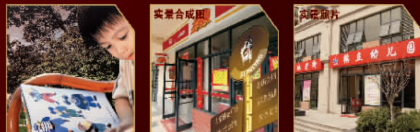
所有图片仅供参考

老街3期采用南北通透的户型设计，以86%左右得房率，精选90-190平米的多款户型，空间格局以平层为主，顶层为带风情阁楼和观景露台的复式结构，实现对景观风景的无限渴望。