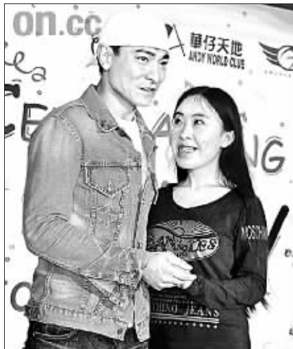
苦追 13 年终于见到偶像刘德华

而对于 68 岁父亲跳海身亡，杨丽娟觉得很值得，虽怀着丧父之痛，但杨丽娟满脑子还是刘德华的影像，她自称完全明白父母心意，并不是不孝。杨母经历丧夫之痛后，心境已慢慢恢复平静，她表示两夫妇做的所有事情，全是自愿，希望女儿能开心，虽然现今家破人亡，不过对女儿仍然支持。