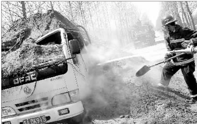
消防队员前来给“满身”是土的农药车救火