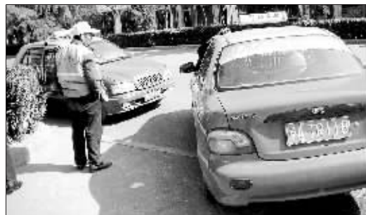
为抢顾客,这两辆出租车在街上“顶牛”

新郑市出租汽车客运管理处一刘姓负责人表示,两个司机的行为都不对。“从新郑到机场,出租车打表的价格应在50元以上。出租车载客时不打表,虽然能争取到顾客,但却损害了其他司机的利益,这种行为实际是不正当竞争。”他说,按照郑州市出租车管理条例规定,出租车载客时必须打表。他还说,豫ATR118司机在公路上挡住别人的车辆也是不对的,出现这种情况应积极投诉,而不应采取过激行为。