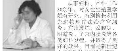
从事妇科、产科工作30余年,对女性生殖医学颇有研究,特别擅长利用先进物理疗法治疗宫颈炎、宫颈糜烂、盆腔炎、阴道炎、子宫内膜炎等各类妇科炎症,并取得了良好的效果。目前是新世纪女子医院独家引进的德国