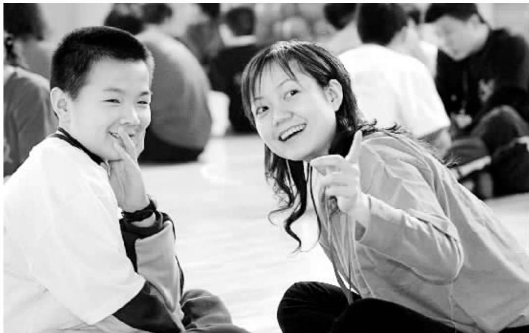
游戏中,孩子们慢慢地发现了问题:既然对陌生人 都可以说心里话,对父母应该可以更轻松地说出来。

是呀,能和陌生人说心里话为什么不能和父母说呢 真好,一个游戏让两代人互说了心里话还紧紧拥抱