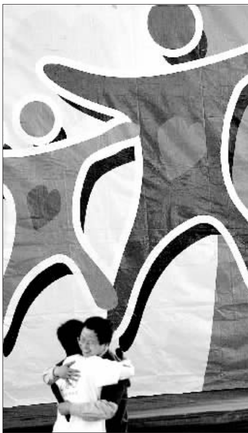
▲做完游戏,这对父子互说了心里话,然后紧紧拥抱在一起。