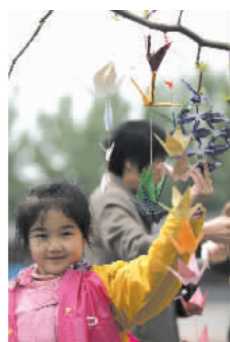
一种姿势,一样祝福