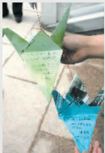
一位残疾人送来的纸鹤上面写满祝福