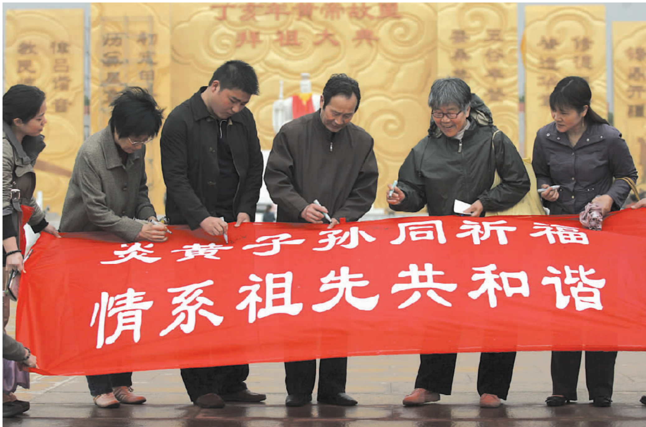
读者代表在本报提供的条幅上签下自己的名字和祝福