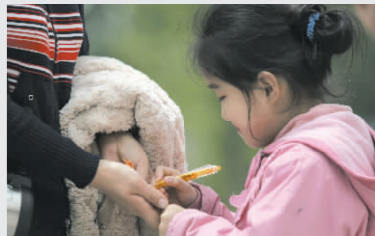
小姑娘现场往纸鹤上写起了祝福

晚报上详细介绍过叠纸鹤方法后,很多读者在此基础上发明创造,用自己的独门绝技,叠出了很多造型独特的纸鹤。