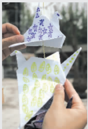
一个孩子送来的纸鹤上画满五角星