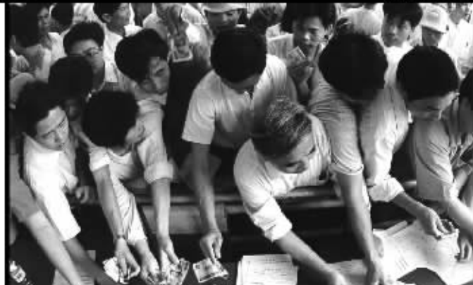
我爱20盒,给30盒,我亲50盒...抢!抢!抢!老顾客抢疯了!

■不损耗,保安全——传统中草配方,激发活力增雄伟力,强精健体,补气益血,精神旺,百不疲,身体好。