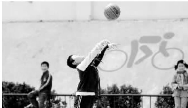
在回答“你经常和谁一起玩”时,很多“特殊家庭”的孩子都在问卷上写下了“一个人玩”。

把调查表送到学生手中的。从学生们填写的问卷中可以看出,他们的态度都很认真,我们在调查前都和他们沟通过,告诉他们这次调查的目的是为了以后校方能做些具体的事情帮助他们,所以他们十分配合。”