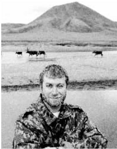
▲这就是阿布 ▼这就是阿布未来的“坐骑”