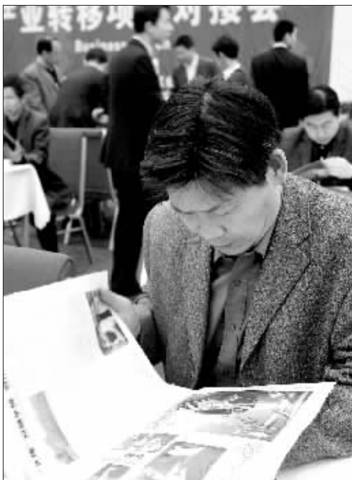
这位客商正在看晚报