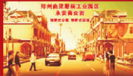
园区永安商业街新街景实拍照片