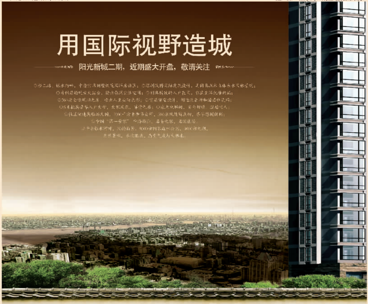
空中观景大露台/惜趣入户花园全景阳光房/顶层架空/5米挑高豪华入户大堂/采光电梯间