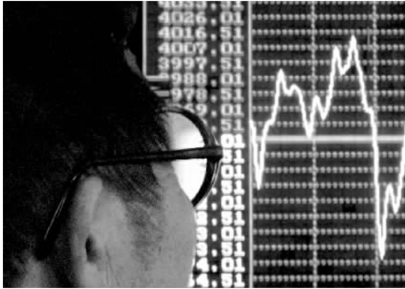
昨天上午,股市成功突破4000点。 晚报记者 马健 图

昨日,是中国股市一个值得记录的日子,因为上证综指第一次突破了4000点大关,并牢牢地站在4000点关口之上。而大盘从3000点到4000点,用了不到2个月的时间。股民收益如何?还有人赔钱吗?到底现在该保持理智,还是应当继续“博傻”?也许,没有人能够给出一个准确的答案。股民们近乎痴狂,证券公司快被挤爆,这一天,中国股市已经等了好久。然而,医生们却在为股民的健康担心。