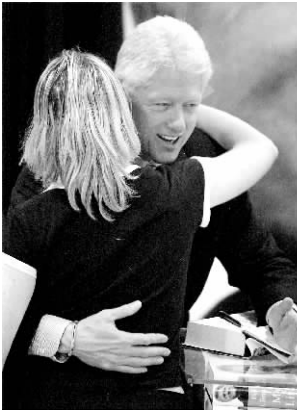
这个画面咋这么眼熟呢？呵呵，当然了，这是美国“非著名行为艺术家”老克最著名、最熟练的自选动作——熊抱。在下唯一敢肯定的是，背对我们的这位年轻白人女子，绝不是那个著名的“斯基”。

朱利亚尼最后也明智地说：“我个人并不反对克林顿今后出任美国大使，无论是共和党还是民主党候选人当选总统，他们都拥有法律赋予的这项权力。但如果希拉里说她任命克林顿担任大使是为了改变美国在海外的形象，则会让人们感到有些意外。”