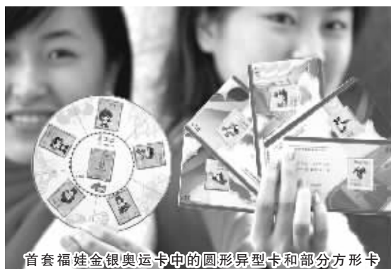
首套福娃金银奥运卡中的圆形异型卡和部分方形卡

标志性奥运藏品 四项纪录高不可攀 首部福娃金银奥运卡,创造了4项收藏记录。首先,它是第一套带面值的纯金奥运卡,而且面值额度最高;第二,43个纯金银奥运福娃首次全体亮相;第三,第一次用邮卡镶嵌形式展现全部38个比赛运动大项;第四,是首次出现圆形