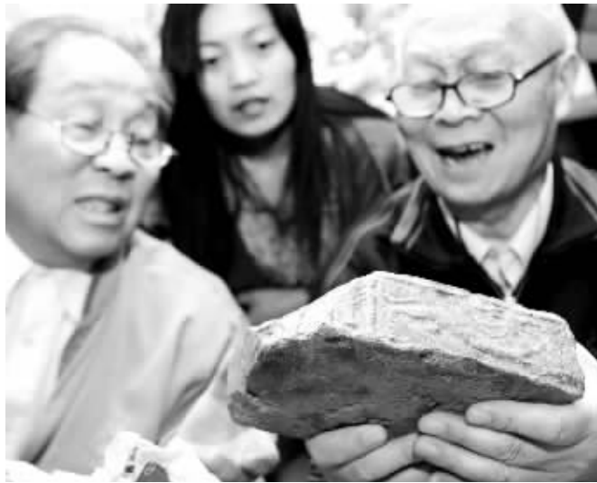
鉴宝专家在鉴定汉砖古砚台

需要提醒市民和藏友的是,本活动是一个民间收藏与交流的平台,坐镇专家或是省博物院退休的研究员、副研究员,或者是某些领域里的权威人士,他们一贯坚持实事求是的原则,就民间藏品的优劣真伪提出可供参考的鉴赏意见,并无私地讲解一些鉴定知识,目的是让市民和藏友在收藏活动中,有一个冷静而客观的认识,重在知识交流和引导,而非某些市民误解的那样给出一个绝对的定论。况且,藏品的交流结果只能由市场说了算。