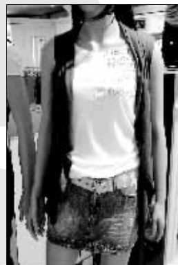
►宽松的上衣代替夹克，过臀的长衬衫加牛仔超短裙的经典搭配可以保你休闲通勤两不误。