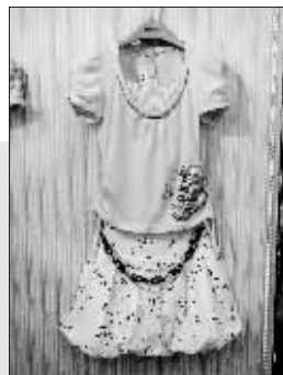
▲简单随性的配搭，让一个个清爽娇媚的邻家女孩形象跃然纸上。

体现度假心情的清透欢快的绿色系列占据着夏流行，水果色持续风靡，将在2007年夏以新奇反常的色调代言都市人内心的游戏渴望。粉红、粉蓝、粉紫与淡黄色也将继续风靡。纯净的粉色搭配也冲淡了带着古旧感觉的暗色系所带来的神秘之外的冷硬。