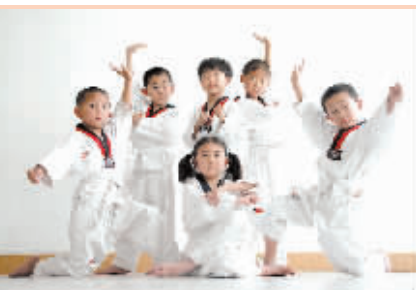
□晚报记者 崔迎/文 马健/图

由本报副刊部与郑州市青少年宫联合举办的“才艺宝宝大比拼”活动目前已经进入决赛阶段,20多名小朋友以自己的精彩才艺,将进行5月27日在市青少年宫进行的决赛,谁表现得最优秀?那就让我们拭目以待吧!