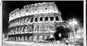
意大利罗马圆形大剧场