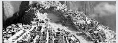
秘鲁印加森林城马丘比丘