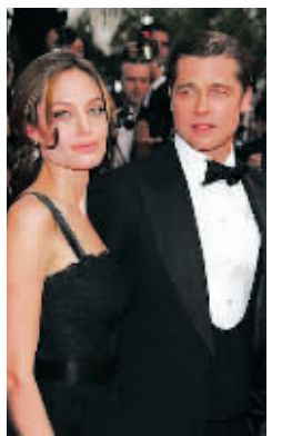
茱莉与皮特在戛纳电影节秀恩爱

候，她更加坚定了去这些地方做慈善的决心。她说：“我不想活在盒子里，我想过大胆的生活，我会对这个世界了解更多。”据悉，在戛纳忙完《勇敢的心》的宣传，她会和孩子们一起回到布拉格，完成另一部新片《通缉》的拍摄。同时，茱莉表示，她会继续投身联合国难民事务，把爱心献给全世界的孩子。 本报综合报道