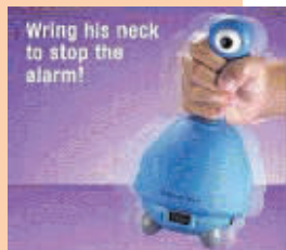
▲Wake or Curse