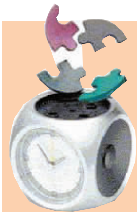
▲Wake Up Puzzle

第一名闪亮登场……两个大轮子?因为一到闹铃时间,它就迅速开动自己,一边叫器一边滚到地上找角落躲起来!如果你不想搬床、搬衣柜的话,请马上起床追赶它!