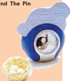
▲Chicken and Egg Problem