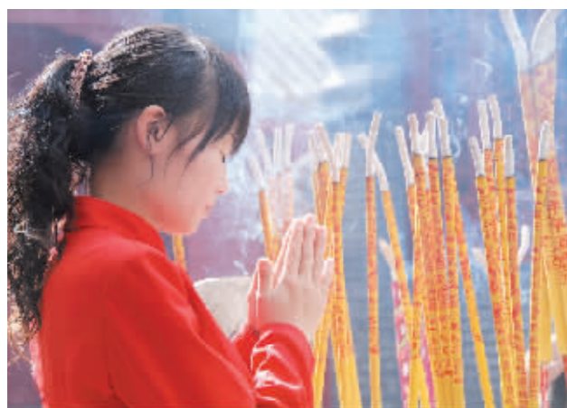
Nikkj Huts (比利时)