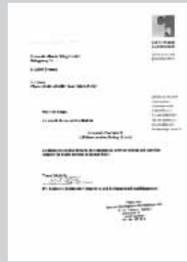
雷氏医学中心证明