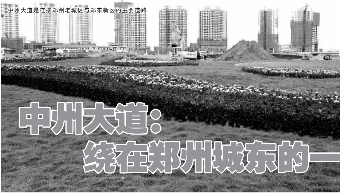
中州大道是连接郑州老城区与郑东新区的主要道路