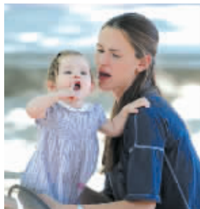
偷拍人家,羞!羞!羞! ——詹妮弗·加纳(本·阿弗莱克的妻子)和女儿