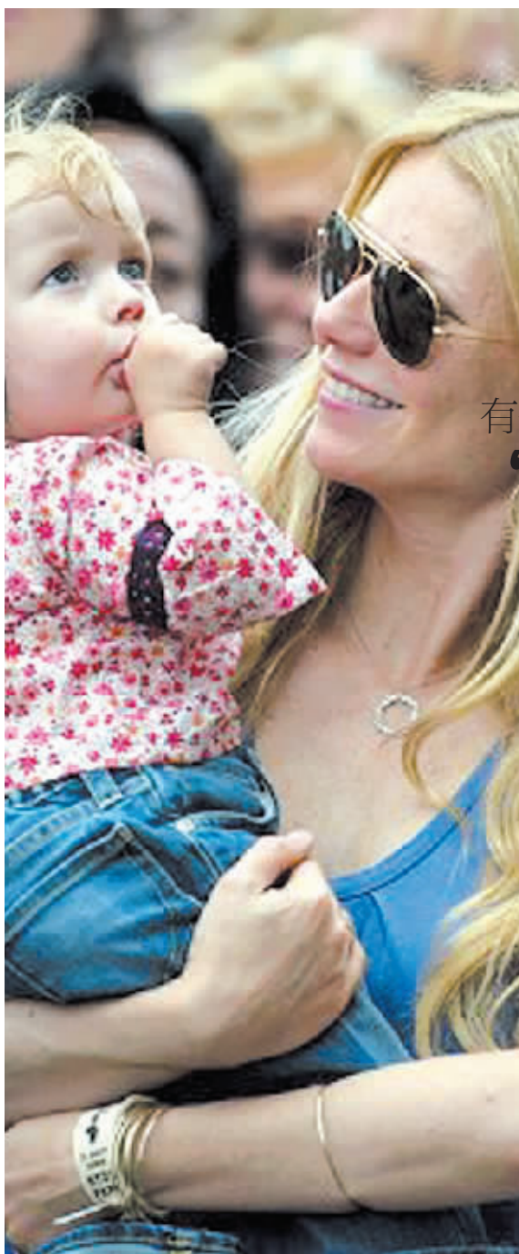
你拍你的,我玩我的。 ——女演员格温妮斯·帕特洛与女儿

记者昨日获悉,省文联、省书法家协会将于6月5日至10日,在省文联新落成的办公大楼内的展览中心,举办我省著名书法家王鸿玉同志书法作品展和书法艺术研讨会。同时,王鸿玉同志近期用篆书创作的《千字文》已经出版,共68张长卷,并附有历代《千字文》篆文浅识,是学习书法的佳品。据悉,这次展出的作品,以篆书为主,包括《千字文》长卷。