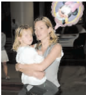
用寒冷的目光“杀死”你们! ——超模凯特·摩丝和女儿