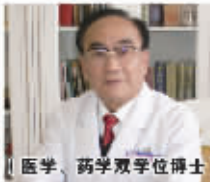
医学、药学双学位博士!

傅海平——我国权威的皮肤病专家，专业从事皮肤病研究30余年，发表专业皮肤病论文百多篇，其关于“扶活素”的论文发表在权威医学杂志《柳叶刀》上发表。因此独创“扶活素”而被誉“改变皮肤病人命运的巨大发现”!