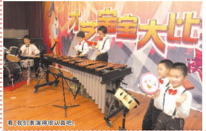
看,我们表演得很认真吧!