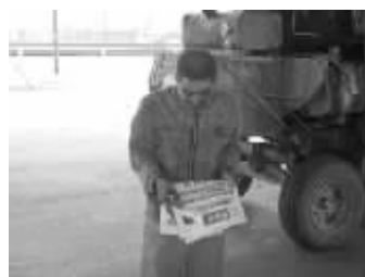
免费赠阅的报纸，为农民兄弟闲暇时间增添乐趣

尽管“三夏”促丰收，建设和谐新农村的活动已近尾声，但是八九月份又是一个收获的季节，真诚的石化人为接下来的秋收做着积极的准备。据介绍，为了迎接秋收农忙，中石化郑州分公司将开展新一轮的“三秋”服务，做好年末收尾工作，为农民兄弟带来更多的实惠。王冠