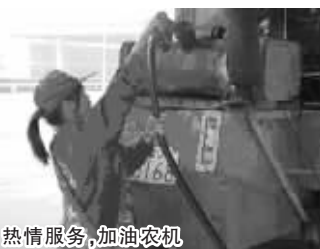
热情服务，加油农机