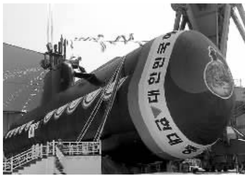
韩国引进德国技术生产的214型常规潜艇的首艇“孙元一”号2006年6月9日下水

本报6月13日讯 韩国1800吨级214型潜艇“郑地”号6月13日下午在蔚山现代重工集团下水。“郑地”号是继“孙元一”号之后的韩国引进德国技术生产的第二艘214型潜艇。