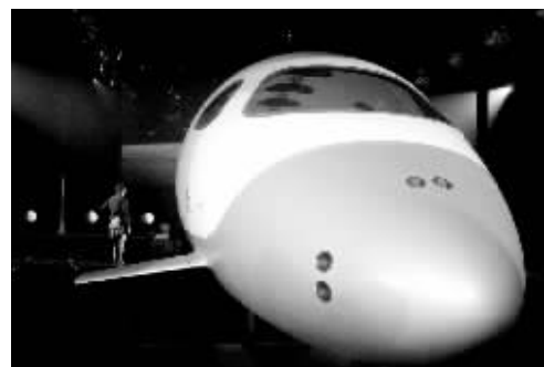
太空飞机很像普通飞机

“那种感觉将无比美好。你会实实在在地置身于地球大气层之外;你能够看到地球作为一个球体的整个面貌,而你周围其他事物都被一片黑色笼罩着。一定有许多人从儿时起便怀揣着这样的梦想。”