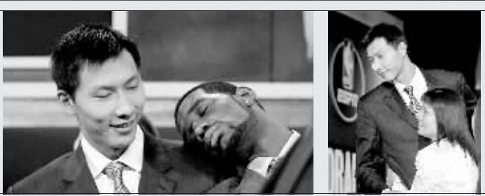
“调皮”的状元借阿联肩膀休息