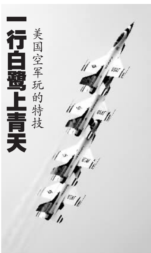
6月28日,在罗马尼亚首都布加勒斯特以东250公里处的一个机场,美国空军“雷鸟”特技飞行表演队在进行飞行表演。

查尔斯王储在上世纪80年代对澳大利亚总督这一职位表示过兴趣,不过他的要求被当时的澳大利亚总理鲍勃·霍克所拒绝。