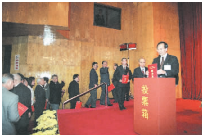
1996年12月21日,香港特别行政区第一届政府推选委员会在广东深圳举行第四次全体会议,选举香港特区临时立法会议员。