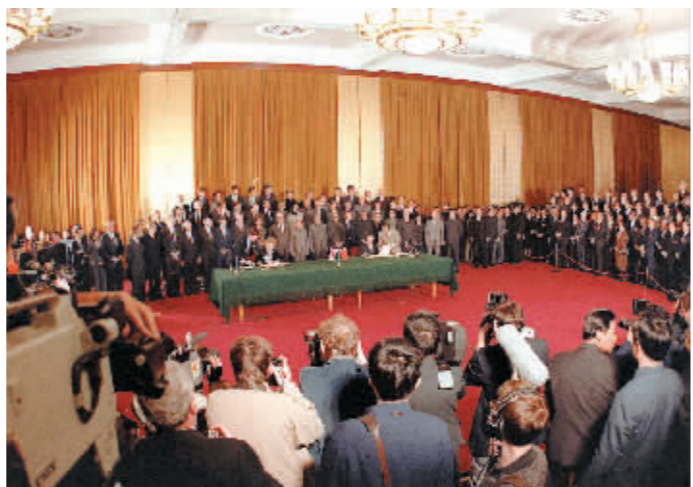
1984年12月19日,中华人民共和国政府和爱尔兰及北爱尔兰联合王国政府关于香港问题的联合声明正式签字。