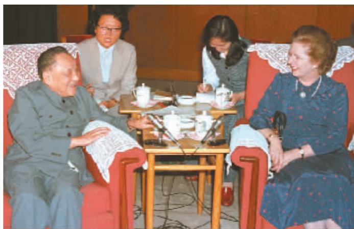
1982年9月24日,邓小平在北京人民大会堂会见英国首相玛格丽特·撒切尔夫人,明确阐述了中国对香港问题的基本立场。