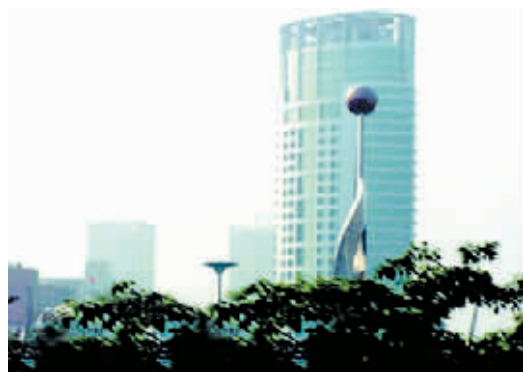
宝安区公路局雄伟的大楼