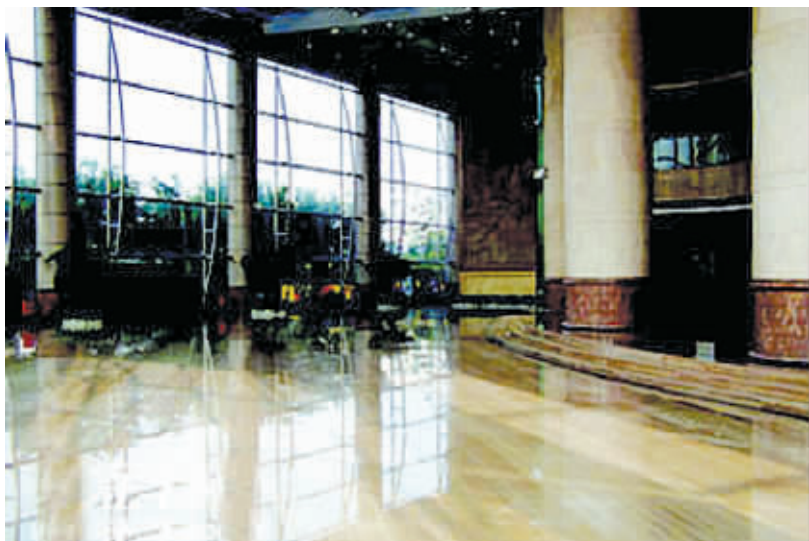
深圳宝安区公路局的大堂装修花了 628.45 万元

记者昨天上午在深圳市宝安区“政府在线”上看到，区委区政府近日决定，对区公路局领导班子做出调整，免去张助浪同志宝安区公路局局长、党委副书记职务；免去林映周同志区公路局党委书记职务。两人工作将另行安排。巫作如主持宝安区公路局全面工作。