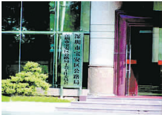
深圳宝安区公路局大门花了 163.4 万元