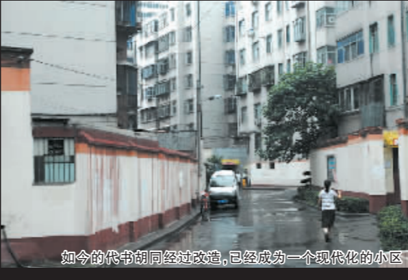
如今的代书胡同经过改造,已经成为一个现代化的小区