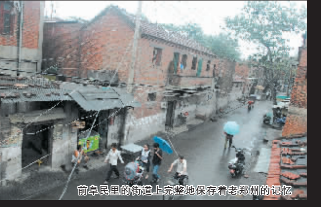
前卓民里的街道上完整地保存着老郑州的记忆