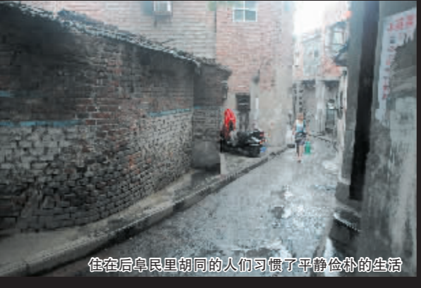
住在后卓民里胡同的人们习惯了平静俭朴的生活