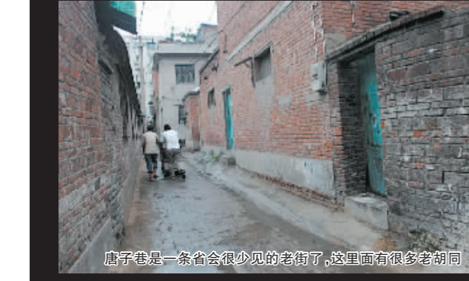
唐子巷是一条省会很少见的老街了,这里面有很多老胡同

代书胡同的兴盛不仅仅是因为毗邻州府衙门,代书胡同南边的驿站也贡献不小。明洪武元年(1368年),管城驿丞王敬祖奉朝廷的命令,在州治西南(即从今西