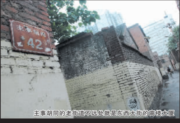
主事胡同的老街道不远处就是东西大街的高楼大厦