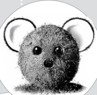
椰子壳做的小老鼠，放在房间里做装饰，很可爱吧？

生活中的创意，层出不穷，在开栏的第一期，小编先集思广益了一下：从网上搜了一些奇思妙想。在欣赏之余，也给有创意的朋友们一些引导——创意栏目需要的，就是这类作品。