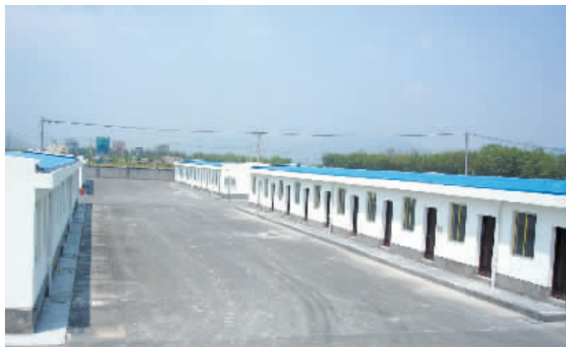
为拾荒者建的“新家”