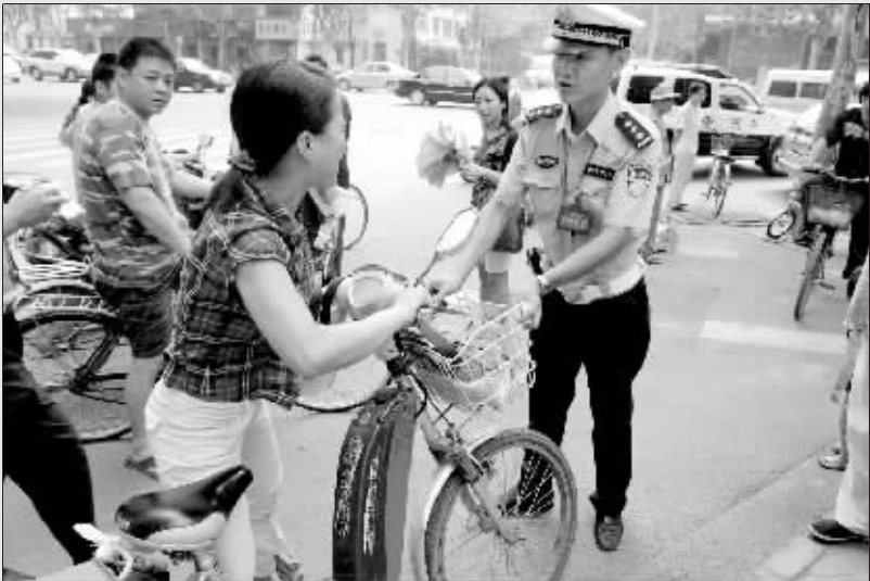
昨日上午,一名不愿接受处罚的女市民推车强行要走,被民警拦下。

电动车专项行动的第一天,交巡警二大队民警在伊河路与嵩山路口,共检查电动车 300 多辆,其中开出罚单 80 多张,拖走近 20 辆。