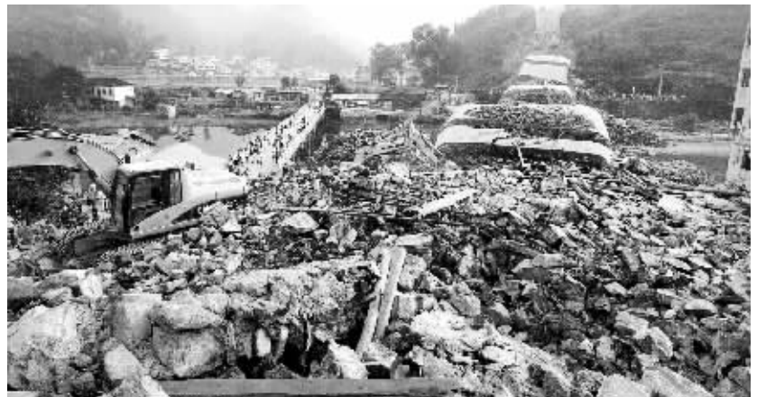
大桥坍塌事故现场。