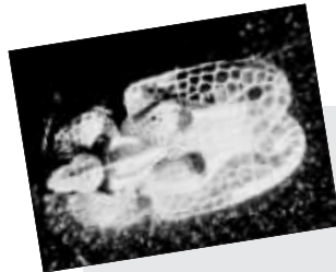
成虫后的方翅网蝽

害虫叫方翅网蝽,还成群侵入居室干扰生活 目前,惠济区已有上百棵法桐受害,其他区正在查找