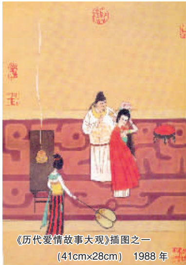
《历代爱情故事大观》插图之一 (41cmx28cm) 1988年