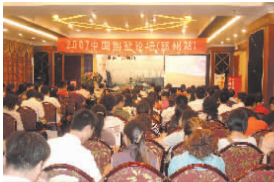
□晚报记者 袁瑞清 李晶

8月18日,2007中国别墅装饰论坛在中州国际饭店隆重举行。本次论坛由北京东易日盛装饰集团联合各地分公司主办、京豫两地别墅设计专家、郑州各大房地产代表、东易日盛联盟材料商代表及20多家媒体出席了这次论坛,来自郑州、洛阳及周边地区的300多名别墅业主和社会精英来到活动现场。 本次别墅论坛上,京城与中原别墅设计专家首次联手,强强联手,共同为郑州别墅装饰设计把脉,分析未来发展趋势。大家一致认为郑州高端大户型装饰市场潜力巨大,国际四大风格将会成为郑州大宅设计的未来发展趋势,东易日盛装饰将成为未来发展趋势的领跑者。